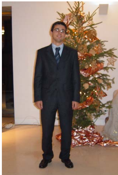
Representante do CDS-PP na Assembleia Municipal