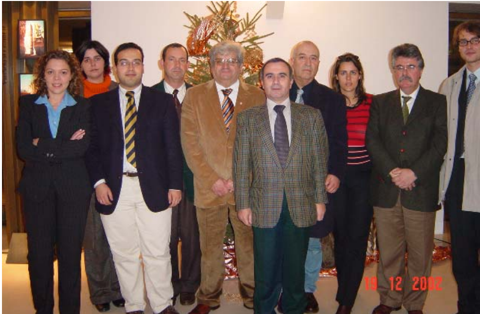
Bancada do PPD/PSD na Assembleia Municipal