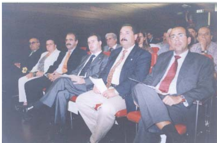
Vereadores da CMO, Presidentes de Junta de Freguesia, Deputados Municipais e demais Convidados