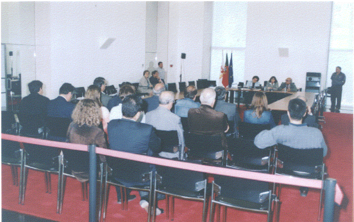
Tomada de posse dos Membros das Comissões no Salão Nobre em 28 de Outubro de 2002