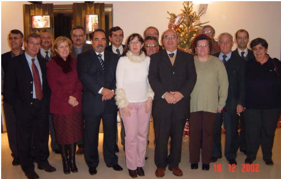
Bancada do PS na Assembleia Municipal