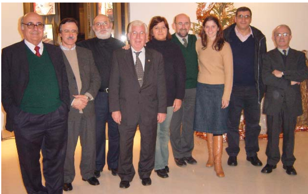
Bancada da CDU na Assembleia Municipal