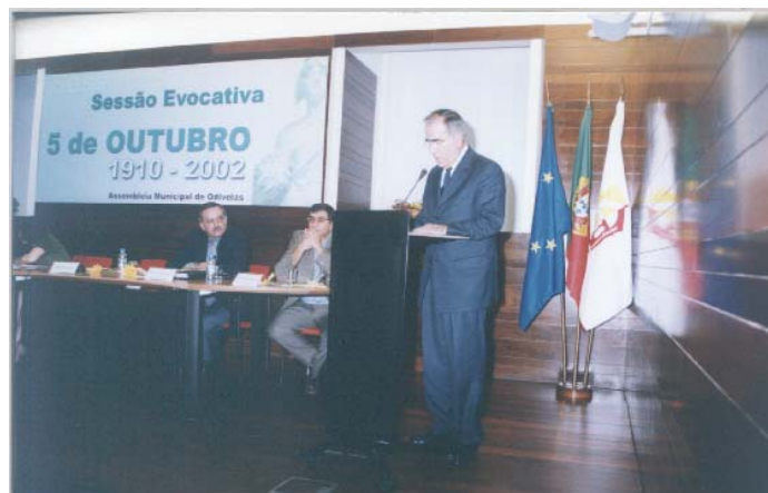
Intervenção do Sr. Presidente da CMO

Transcreve-se de seguida as intervenções supra referidas, que melhor ilustram as posições definidas.