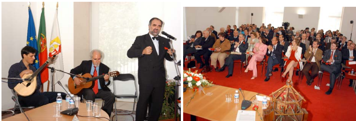
Apontamentos de Poesia que mereceram grande ovação por parte dos presentes