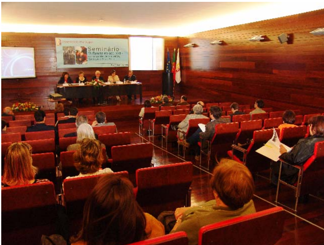
Decorrer dos trabalhos