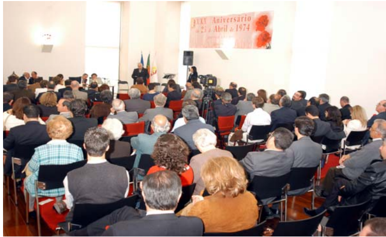
Perspectiva do público presente