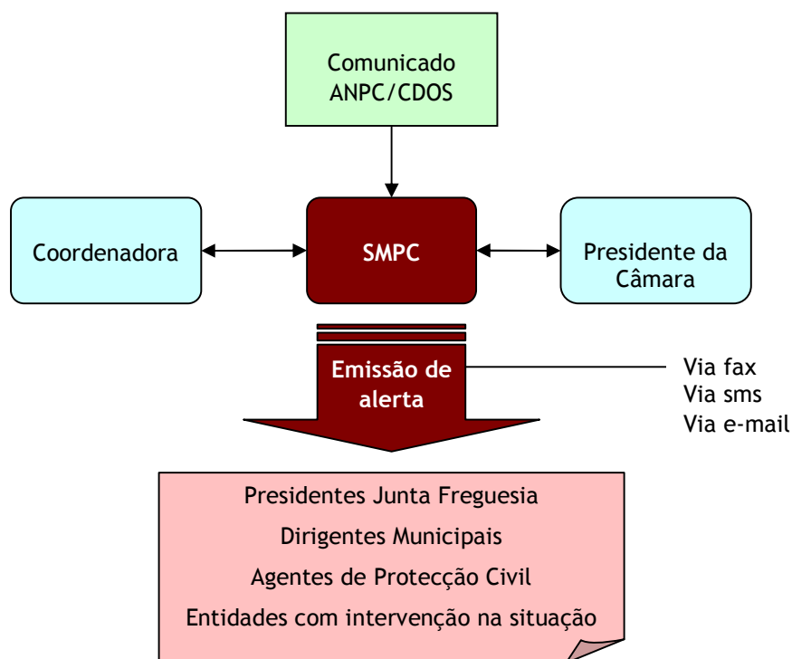
Figura 6 - Emissão de alertas

Este sistema de alerta das entidades e organismos que poderão ser chamados a intervir, em caso de eminência e/ou ocorrência de acontecimentos susceptíveis de provocar danos em pessoas e bens, é um sistema redundante, i.e, são utilizados em simultâneo diversos meios de difusão da informação (fax, e-mail e sms) por forma a garantir a fiabilidade da comunicação, em caso de falha de uma das vias.