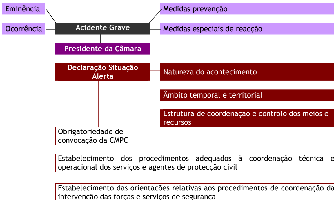
Figura 5 - Declaração de situações de alerta