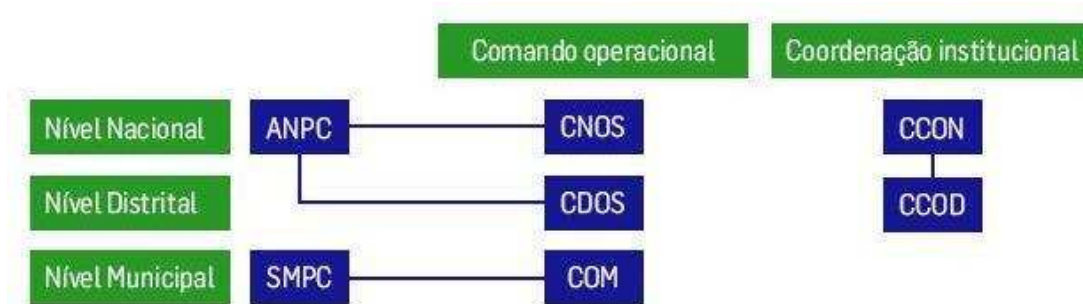
Figura 4 - Estrutura das operações (de acordo com a Lei n.º 65/2007 e Decreto-Lei n.º 164/2006)

Assim, em termos de estrutura operacional tem-se: