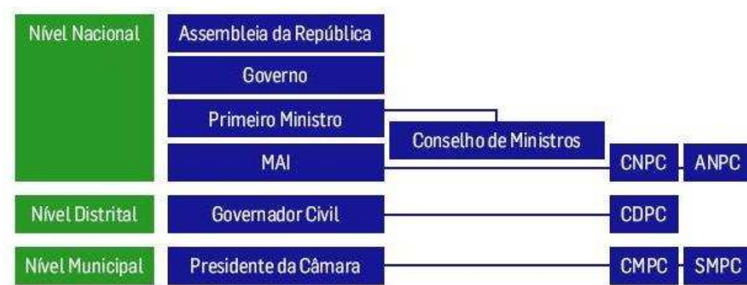
Figura 3 - Estrutura da Protecção Civil (de acordo com a Lei de Bases da Protecção Civil)

Retirado de Cadernos técnicos ProCiv - 3 - Manual de apoio à elaboração e operacionalização de Planos de Emergência de Protecção Civil