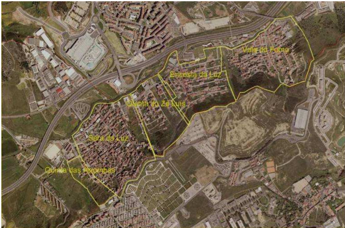
Fotografia aérea em 2005

A falta de equipamentos sociais, culturais e desportivos, de infra-estruturas de apoio quotidiano à população residente, o fraco dinamismo económico, os problemas de integração social e as progressivas situações de marginalização, degradação, pobreza e desqualificação social carecem de uma resposta concertada e de uma urgente intervenção pública.