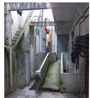
Fotografias exemplificativas da estrutura urbana e condições do edificado