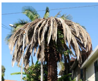
Fig.1 – Folhas prostradas

Em caso de observação de algum dos sinais ou sintomas abaixo descritos, solicitamos o preenchimento desta ficha e o envio para a Câmara Municipal de Odivelas/Departamento de Ambiente e Transportes/Divisão de Parques e Jardins.