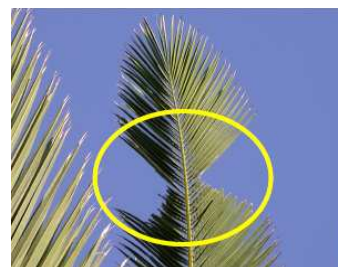
Fig. 3 – Recorte nas folhas

Assinale com (X) os sinais ou sintomas observados: