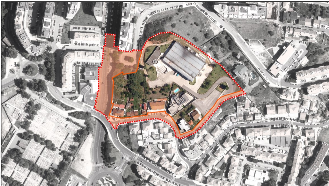
Figura 03: Área pertencente ao Domínio Público da UE Casal dos Pastores