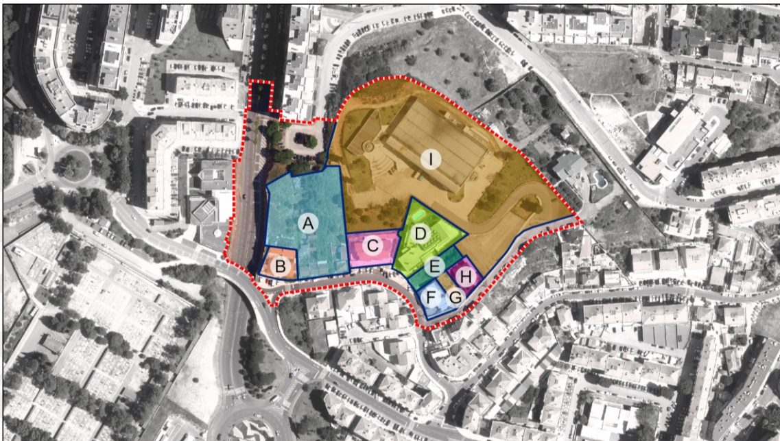
Figura 02: Prédios de Propriedade Privada da UE Casal dos Pastores

Os valores das áreas dos prédios abrangidos foram aferidos em sede dos respetivos Processos de Obra.