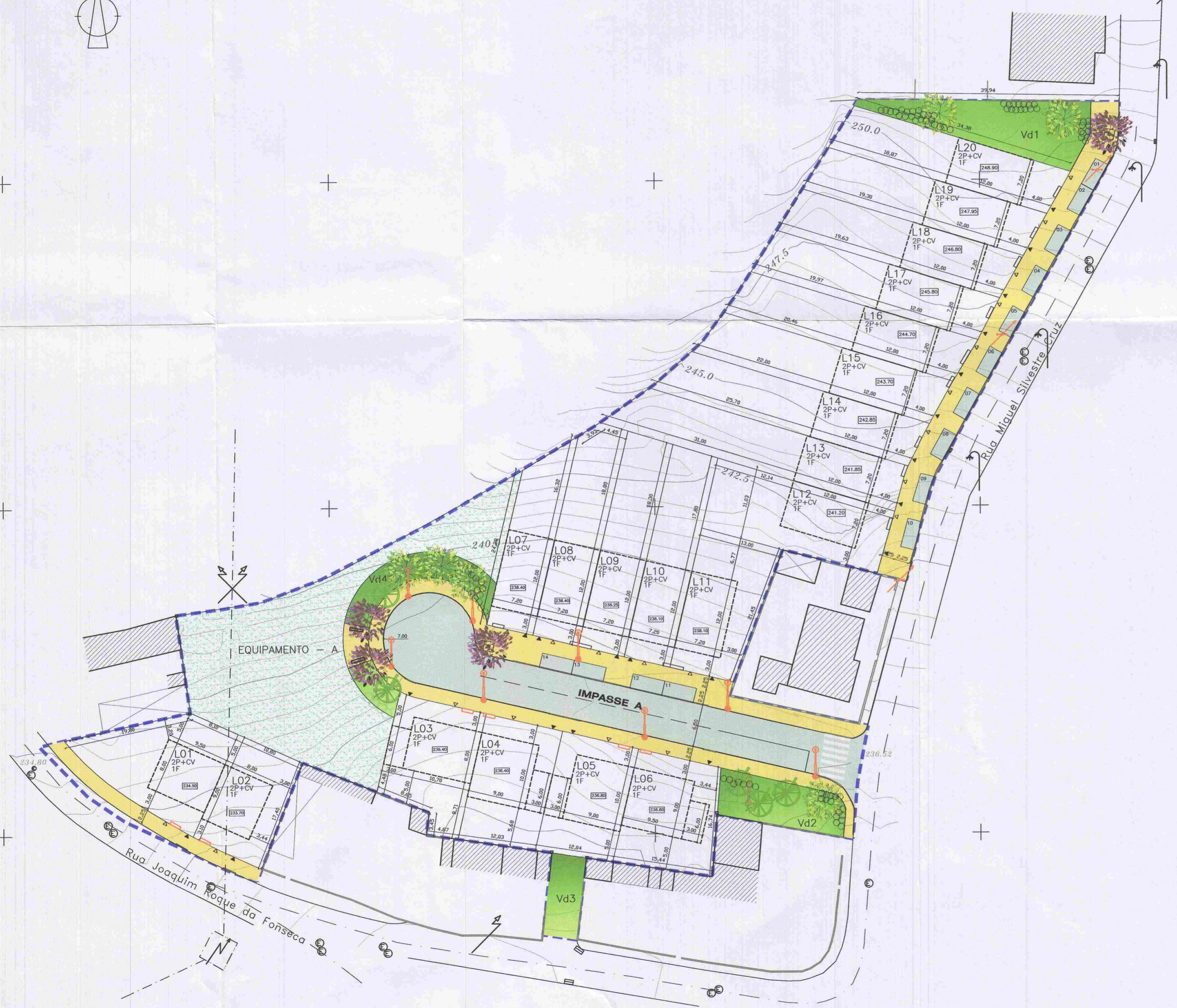
Quadro de Lotes