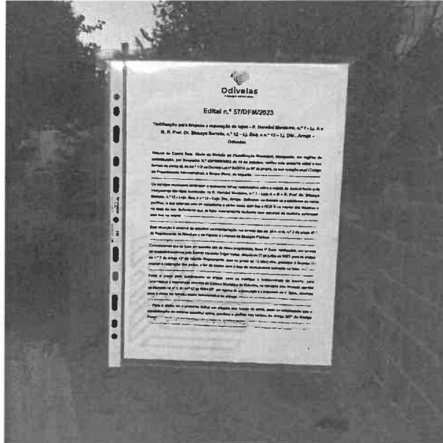
Foto rua Prof. Dr. Bissaya Barreto nº 12 loja Esq.